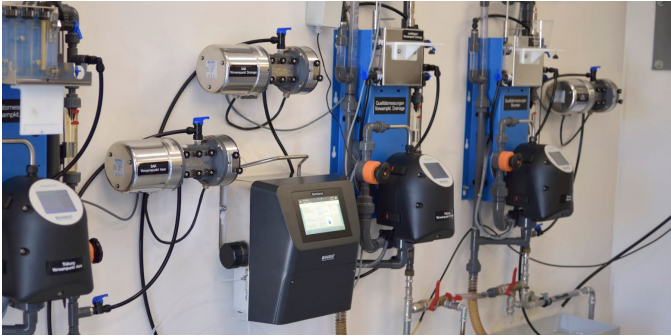
Figure 3: BactoSense installés dans un captage d'eau souterraine

Surveillance du nombre total de germes et de la répartition en germes grands et petits dans de l'eau brute