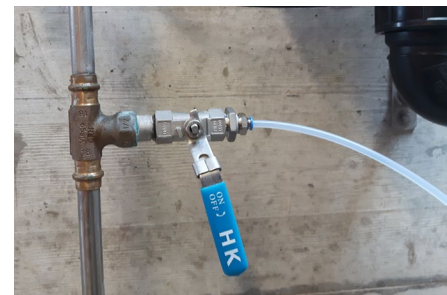
Figure 5: Réglage de débit simple pour obtenir les 200 à 400 ml/min en permanence, nécessaire lors du prélèvement en ligne