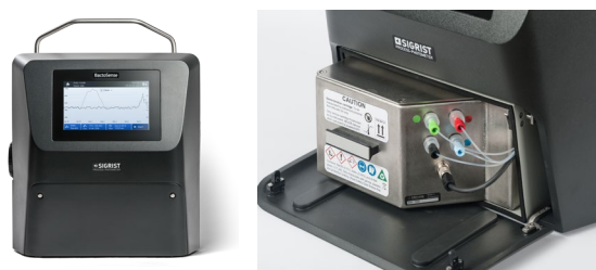
Figure 2: BactoSense avec cartouche

99% des germes microbiens sont détectés et signalés dans seulement 20 minutes. Fondées sur ces mesures, les dispositions nécessaires peuvent être prises pour maintenir la bonne qualité de l'eau potable.